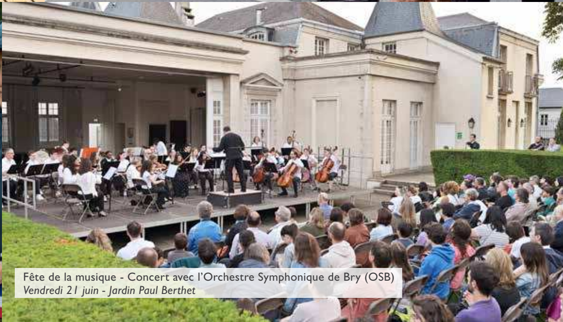
Fête de la musique - Concert avec l'Orchestre Symphonique de Bry (OSB) Vendredi 21 juin - Jardin Paul Berthet