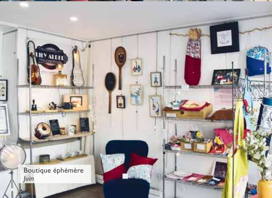
Boutique éphémère Juin