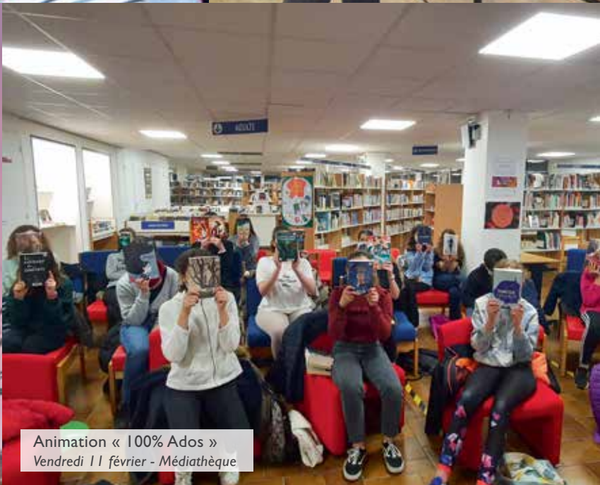
Animation « 100% Ados » Vendredi 11 février - Médiathèque