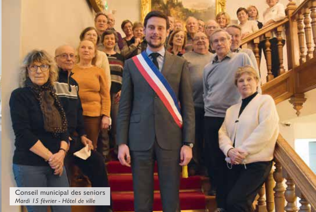
Conseil municipal des seniors Mardi 15 février - Hôtel de ville