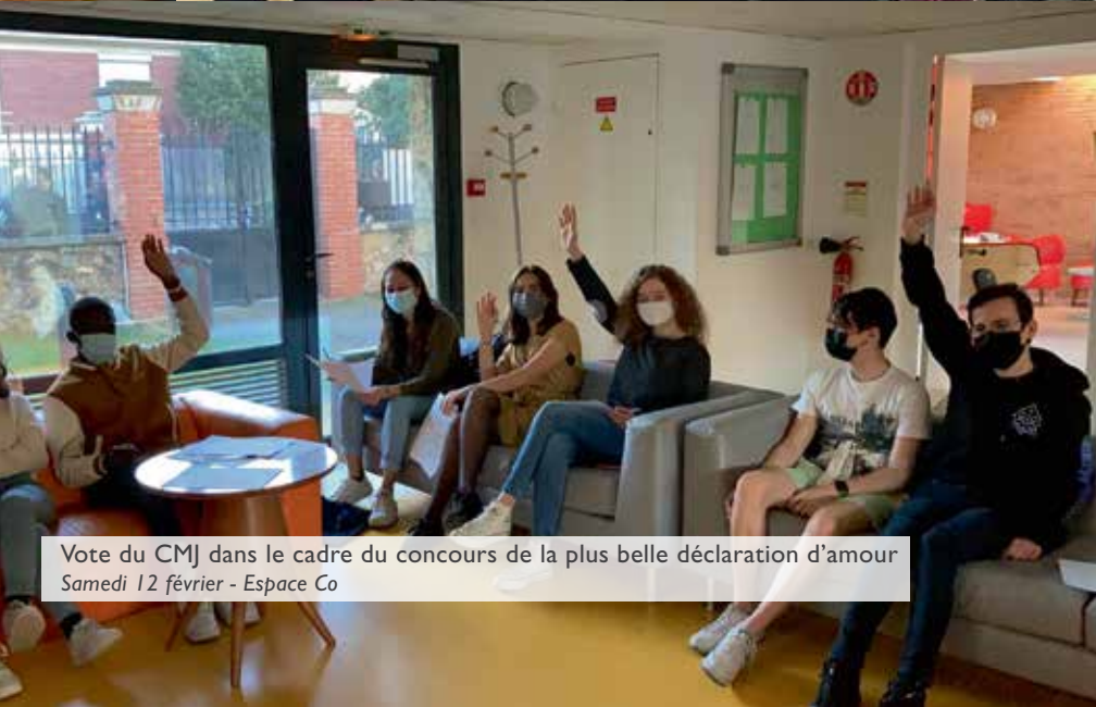
Vote du CMJ dans le cadre du concours de la plus belle déclaration d'amour Samedi 12 février - Espace Co