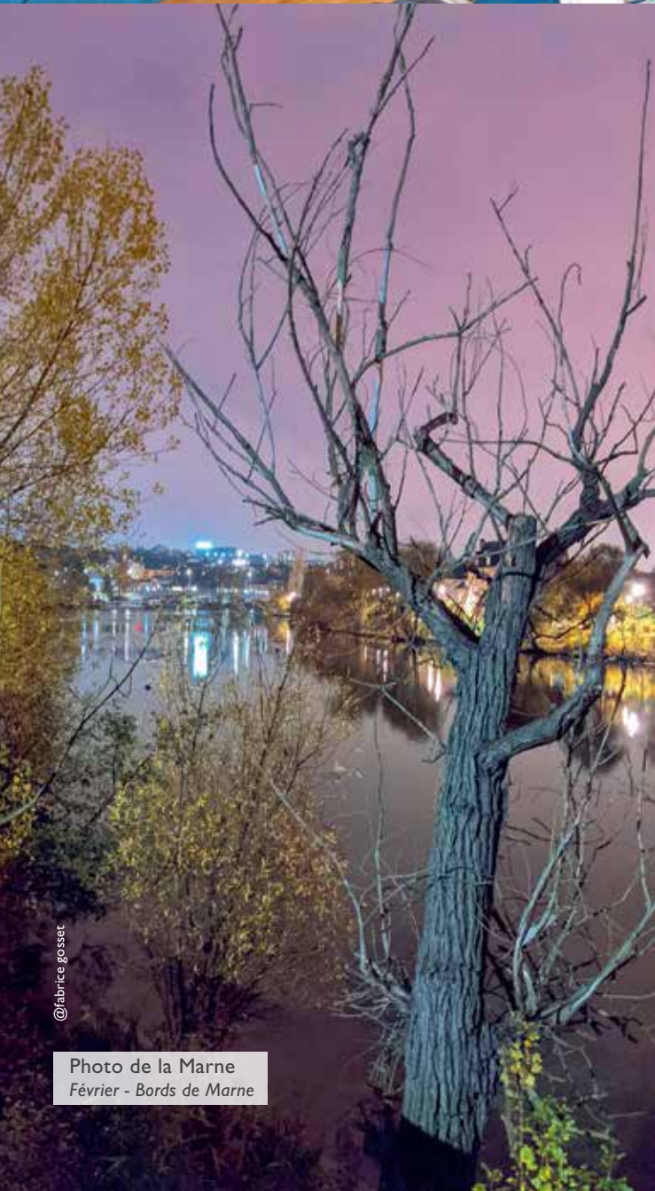
Photo de la Marne Février - Bords de Marne