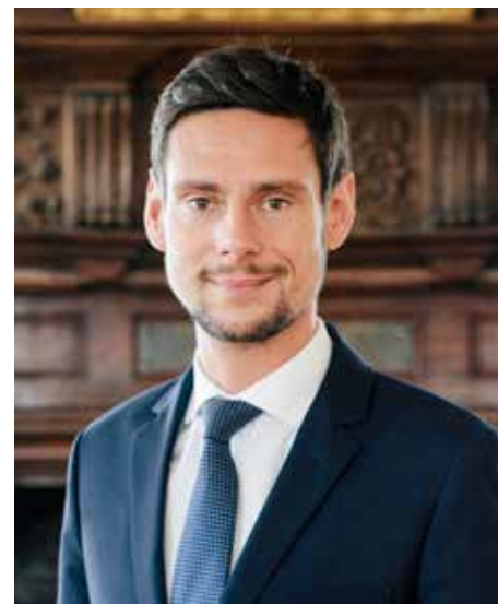
Charles ASLANGUL Maire de Bry-sur-Marne Vice-président du Territoire Conseiller Métropolitain

• Or, le PLUi devra lui-même être compatible avec le Schéma de cohérence territoriale (SCOT) de la Métropole du Grand Paris ! Ce document métropolitain s'impose aux 131 communes de la Métropole.