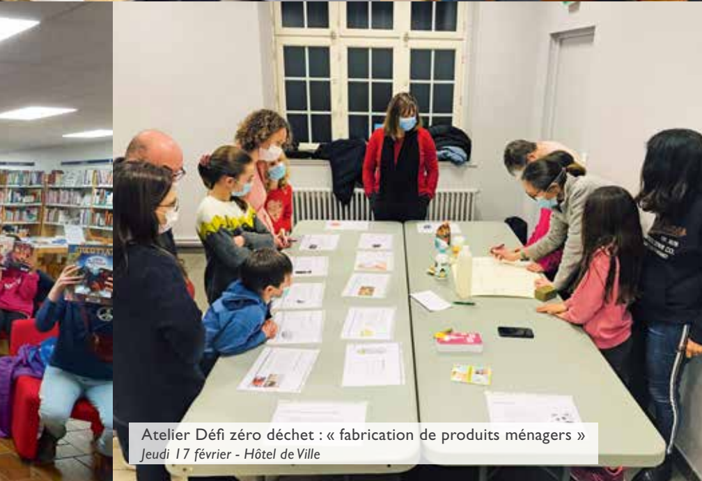
Atelier Défi zéro déchet : « fabrication de produits ménagers » Jeudi 17 février - Hôtel de Ville