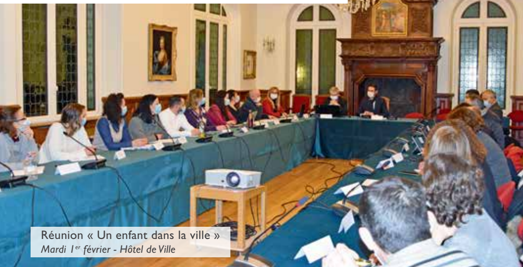
Réunion « Un enfant dans la ville » Mardi 1 er février - Hôtel de Ville