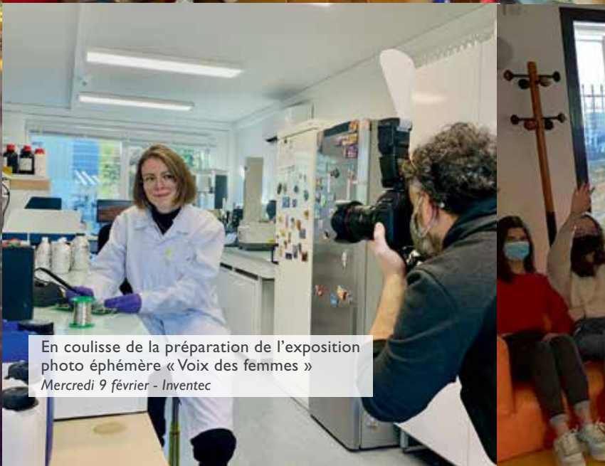
En coulisse de la préparation de l'exposition photo éphémère « Voix des femmes » Mercredi 9 février - Inventec