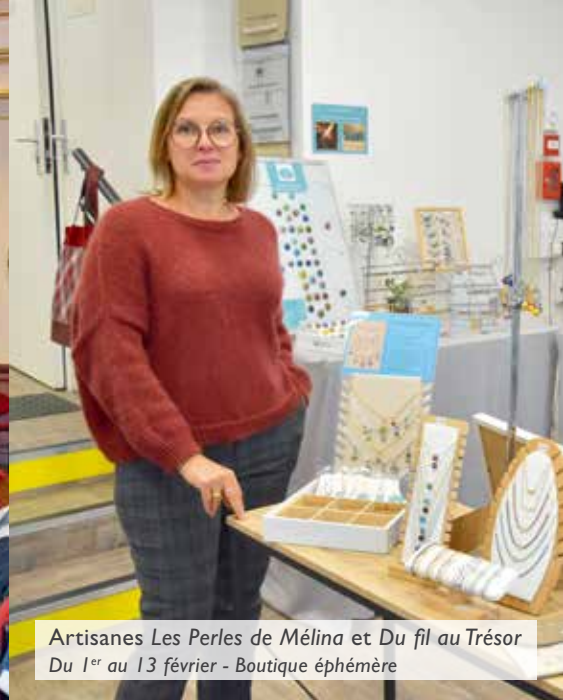
Artisanes Les Perles de Méлина et Du fil au Trésor Du 1 er au 13 février - Boutique éphémère