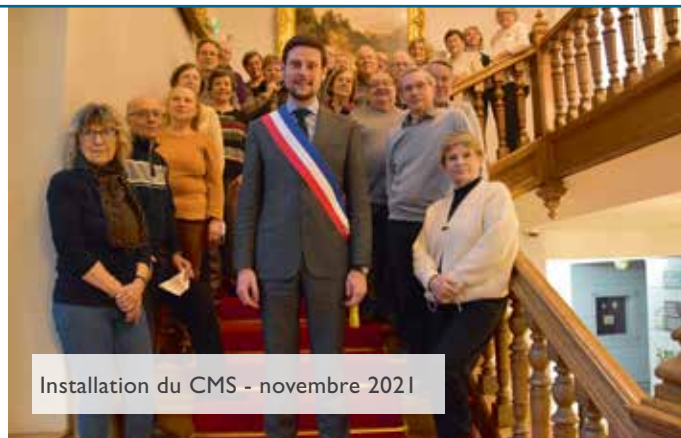
Installation du CMS - novembre 2021