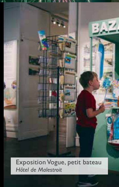
Exposition Vogue, petit bateau Hôtel de Malestroit