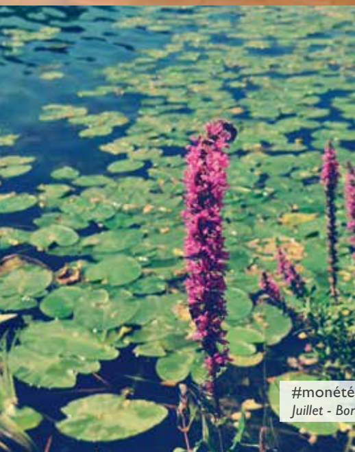
#monétéabry2022 Juillet - Bords de Marne