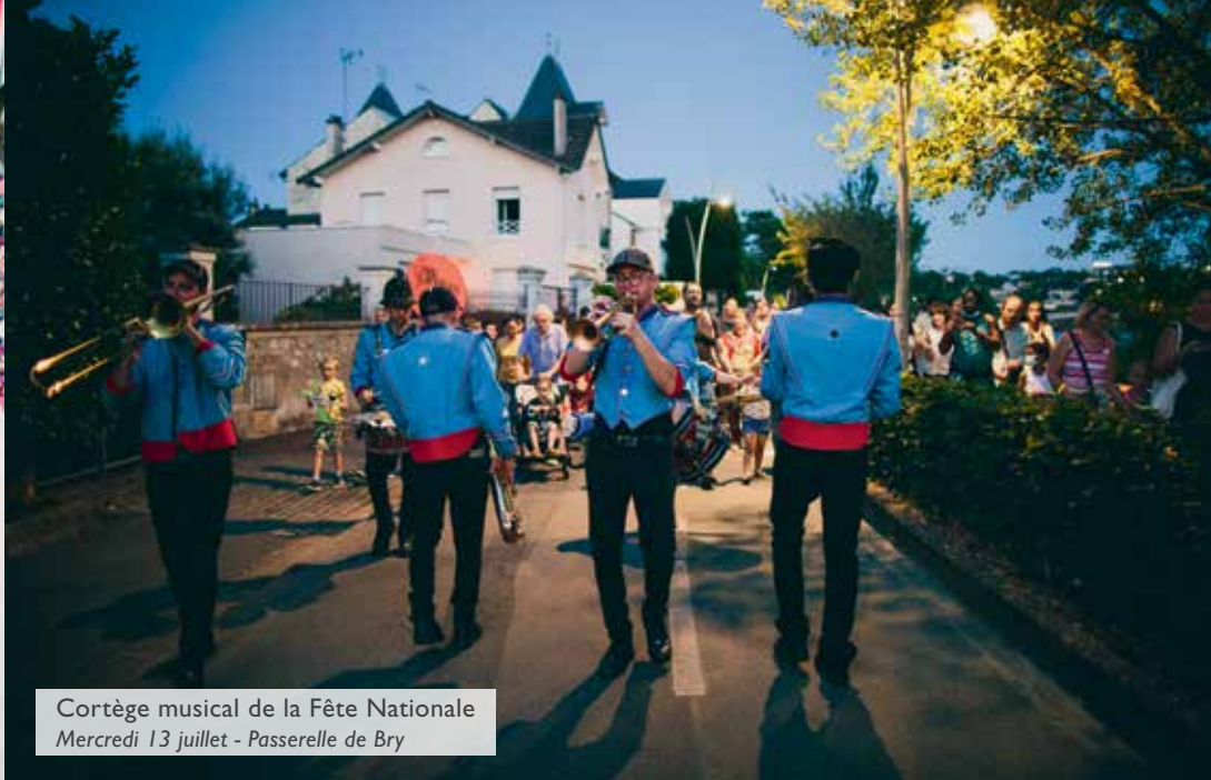
Cortège musical de la Fête Nationale Mercredi 13 juillet - Passerelle de Bry