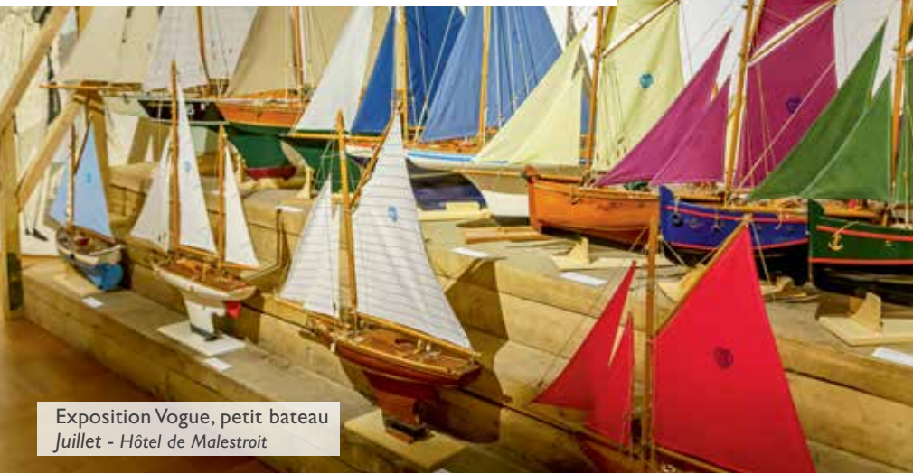
Exposition Vogue, petit bateau Juillet - Hôtel de Malestroit