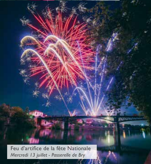
Feu d'artifice de la fête Nationale Mercredi 13 juillet - Passerelle de Bry