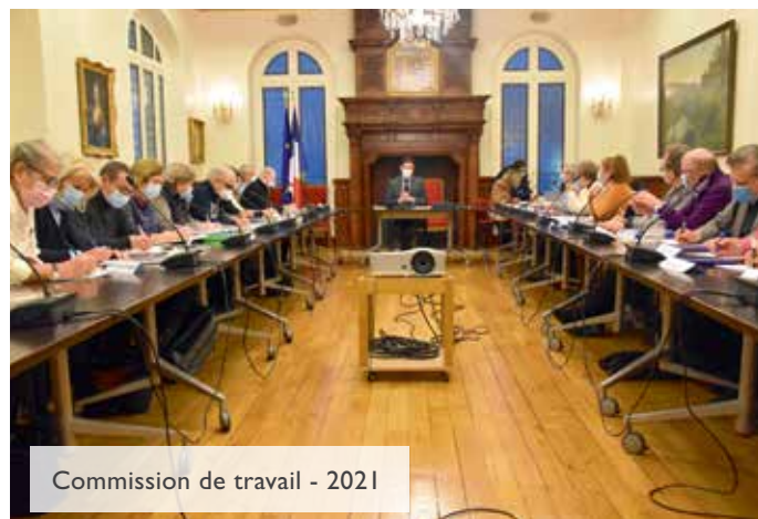
Commission de travail - 2021