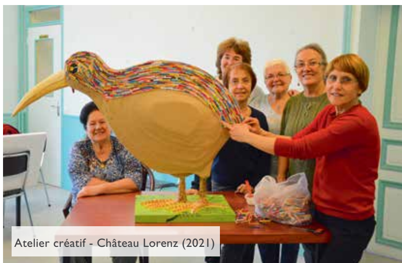
Atelier créatif - Château Lorenz (2021)