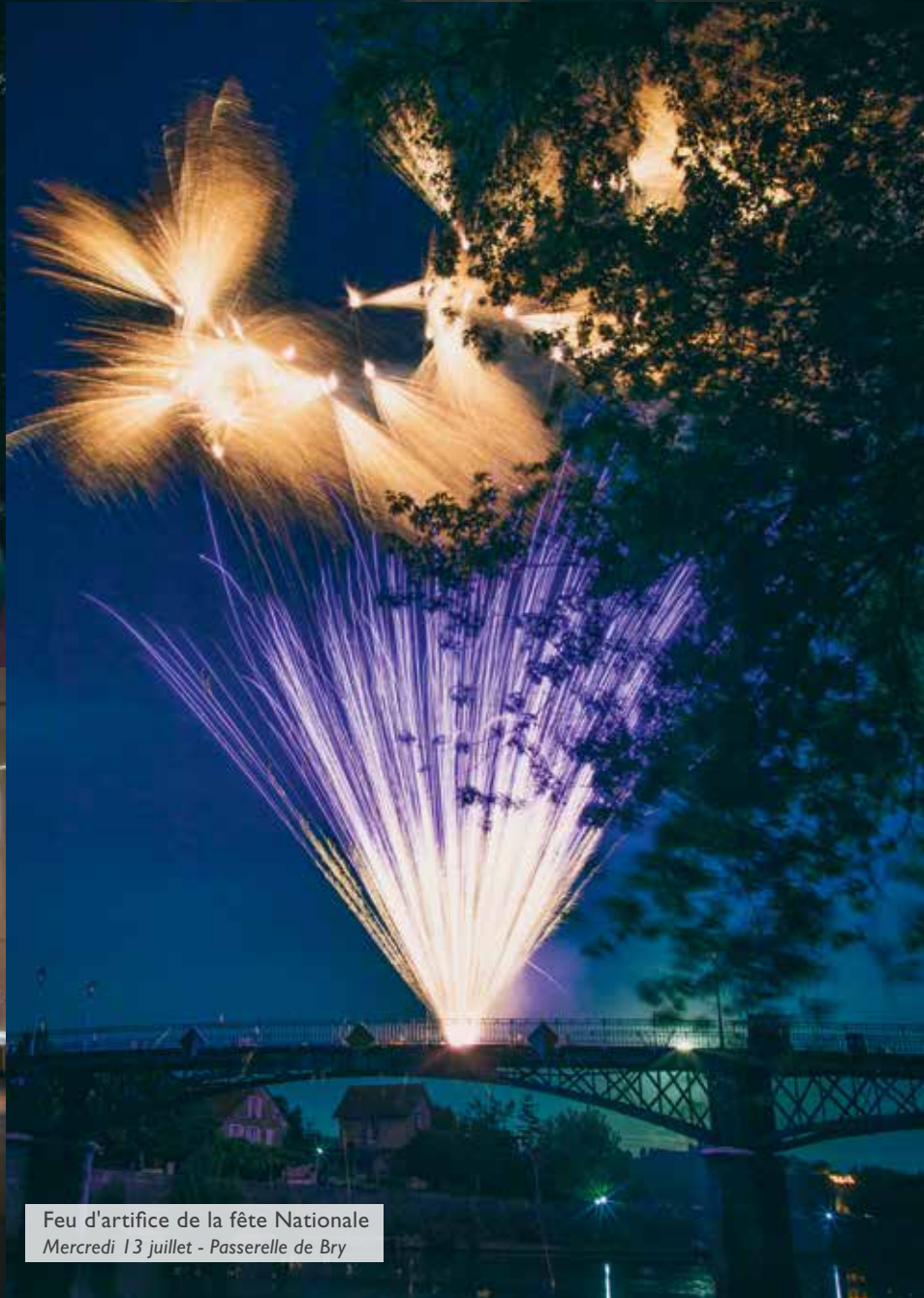
Feu d'artifice de la fête Nationale Mercredi 13 juillet - Passerelle de Bry