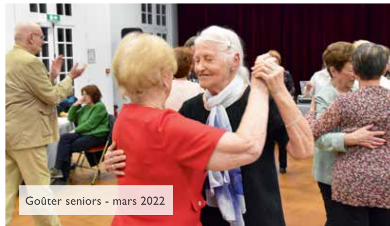
Goûter seniors - mars 2022

En parallèle, la Ville favorise les actions et partenariats avec le tissu associatif bryard, notamment par le biais de conventions annuelles qui permettent le versement de subventions à l'année, la mise à disposition de locaux, l'entretien des bâtiments etc. Les associations du Rayon de Soleil Bryard (voir p16) ou du ColiBry en sont un bon exemple. Des actions prises en faveur des seniors et de la solidarité, qui font parties des lignes directrices de l'équipe municipale. ■