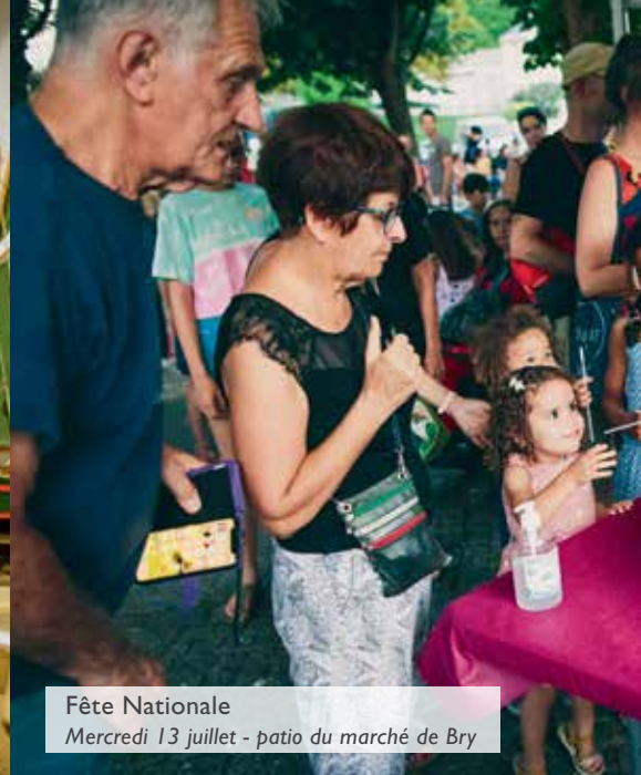
Fête Nationale Mercredi 13 juillet - patio du marché de Bry