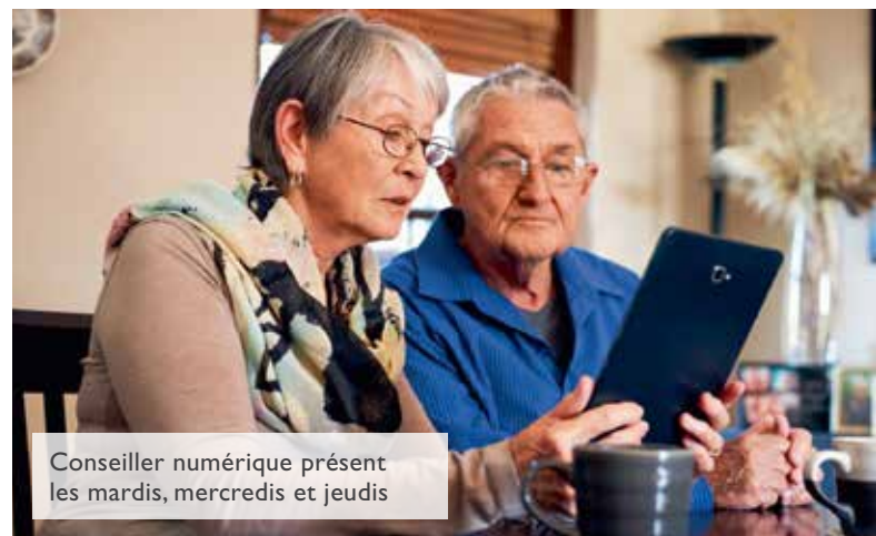
Conseiller numérique présent les mardis, mercredis et jeudis

+d'infos à la mairie au 01 45 16 68 00 ou à social@bry94.fr