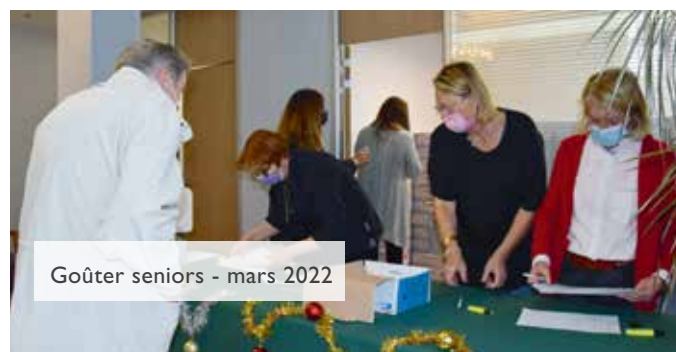
Goûter seniors - mars 2022

Lors des fêtes de fin d'année, la Ville distribue des colis remplis de douceurs aux seniors. En 2021, 928 seniors bryards âgés de