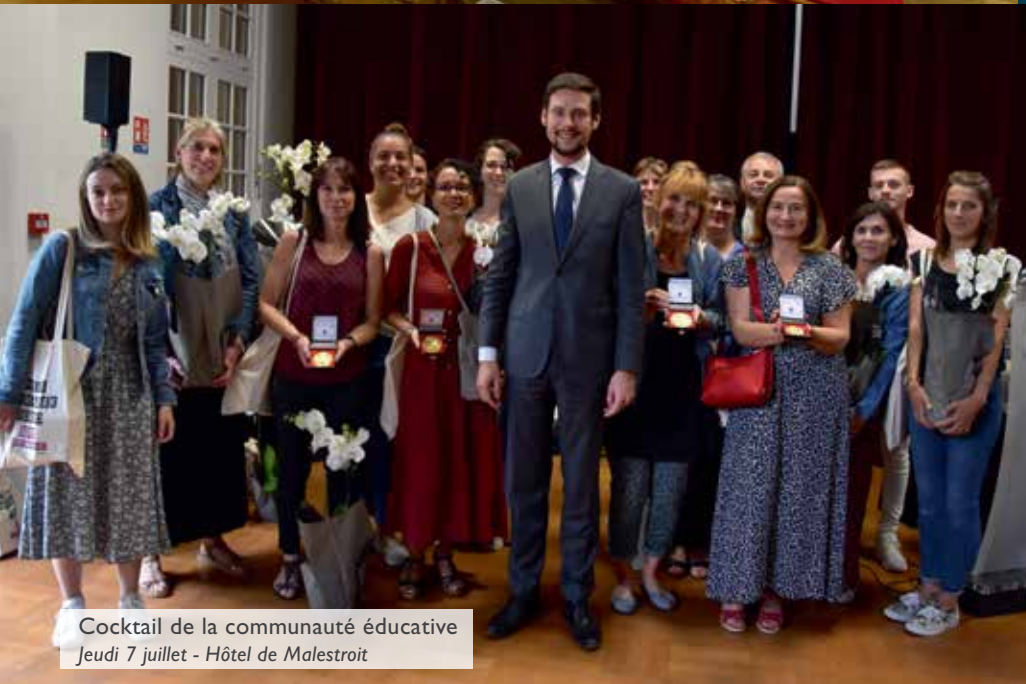
Cocktail de la communauté éducative Jeudi 7 juillet - Hôtel de Malestroit